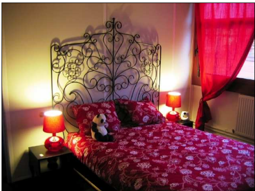
Figure 7 : Appartement « Domus » du LSI Carnot.

Pour le projet « Domus », dans le cadre de l'institut Carnot LSI 10 , nous avons construit sur le plateau le prototype d'un appartement intelligent (40 m 2 ). Cet appartement est destiné à être à la fois une vitrine, un démonstrateur et surtout un banc d'essai des nouvelles techniques d'interaction en domotique, dans la philosophie des Living Labs . Ces techniques vont ainsi pouvoir être mises en œuvre et évaluées dans un cadre réaliste. En effet, cet appartement comprend un ensemble de pièces représentatives d'un appartement classique (bureau, chambre, salle de bains et cuisine avec salle à manger) et dispose d'un véritable mobilier (figure 7). De plus, l'ensemble du système électrique de l'appartement est contrôlé par un système domotique, basé sur le standard actuel KNX. Il inclut également des lecteurs d'étiquettes RFID pour une interaction utilisant des objets tangibles.