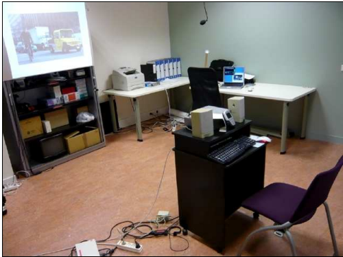
Figure 2 : Salle d'expérimentation (20 m 2 ).

La salle d'expérimentation (20 m 2 ) est destinée aux expérimentations de dispositifs classiques (clavier-souris-écran) ou aux expérimentations utilisant l'oculométrie. Elle est généralement utilisée avec au maximum un ou deux sujets (figure 2). Elle sert également en binôme avec le plateau lorsque des expérimentations liées au travail collaboratif sont mises en place.