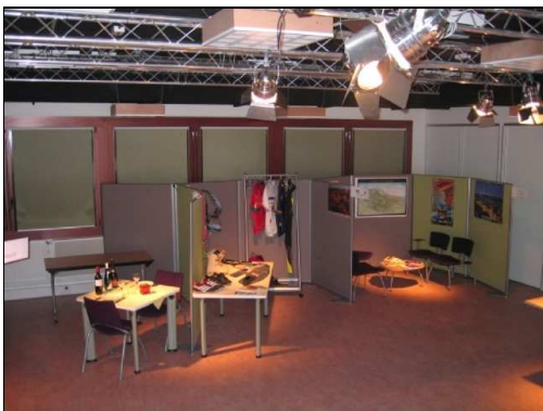
Figure 3 : Plateau d'expérimentation (100 m 2 ).

Le plateau (100 m 2 ) constitue un espace modulaire de simulation d'environnements interactifs (figure 3). À la manière d'une scène de théâtre, le plateau dispose de projecteurs permettant le contrôle de l'ambiance lumineuse, de structures porteuses destinées à accueillir toutes sortes de dispositifs (cloisons temporaires, caméras, micros, projecteurs, vidéoprojecteurs, antennes RFID, etc.). Actuellement, l'appartement Domus occupe une petite moitié du plateau.