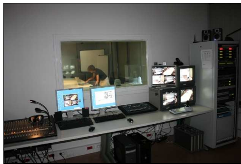
Figure 4 : Régie avec sa glace sans tain.

La régie occupe une place centrale sur la plateforme (figure 4). Elle dispose de deux glaces sans tain permettant une vue directe sur la salle d'expérimentation et le plateau. C'est également le centre névralgique du système de contrôle de l'environnement et d'acquisition de données de la plateforme. En effet, tous les flux de contrôle et tous les flux d'information issus des systèmes présents sur la plateforme convergent vers la régie. Elle accueille également tout le matériel électronique et informatique nécessaire au fonctionnement des systèmes d'acquisition.