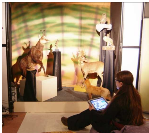
Figure 6 : Sujet utilisant un écran tactile mobile (Muséum d'Histoire Naturelle de Grenoble).

Dans le cadre d'une prestation pour le Muséum d'Histoire Naturelle de Grenoble 9 , nous avons été chargés d'évaluer de nouvelles techniques d'interaction en médiation muséale. Pour cela, nous avons reconstitué sur les 100 m 2 du plateau cinq espaces d'exposition présentant une partie des véritables collections du musée. Les sujets-visiteurs pouvaient ainsi parcourir librement ces cinq espaces et interagir avec les collections via les différents dispositifs de médiation mis à leur disposition, tels qu'un tapis tactile, une vitrine à opacification commandée, une borne rotative et un écran tactile mobile (figure 6). Une partie des systèmes interactifs étaient simulés grâce à la technique du magicien d'Oz.